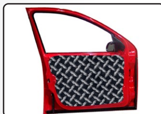
DYNAPLATE e XTREME