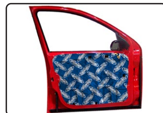
DYNAPLATE e SUPERLITE